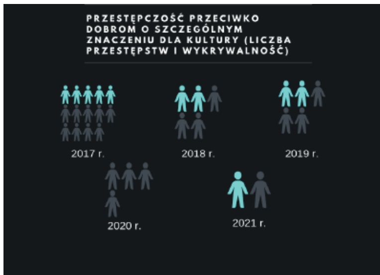
Rysunek 3. Ewolucja przestępczości przeciwko dobrom o szczególnym znaczeniu dla kultury na terenie województwa małopolskiego