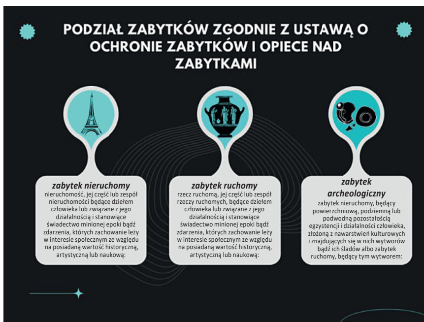
Rysunek 1. Podział zabytków zgodny z Ustawą o ochronie zabytków i opiece nad zabytkami