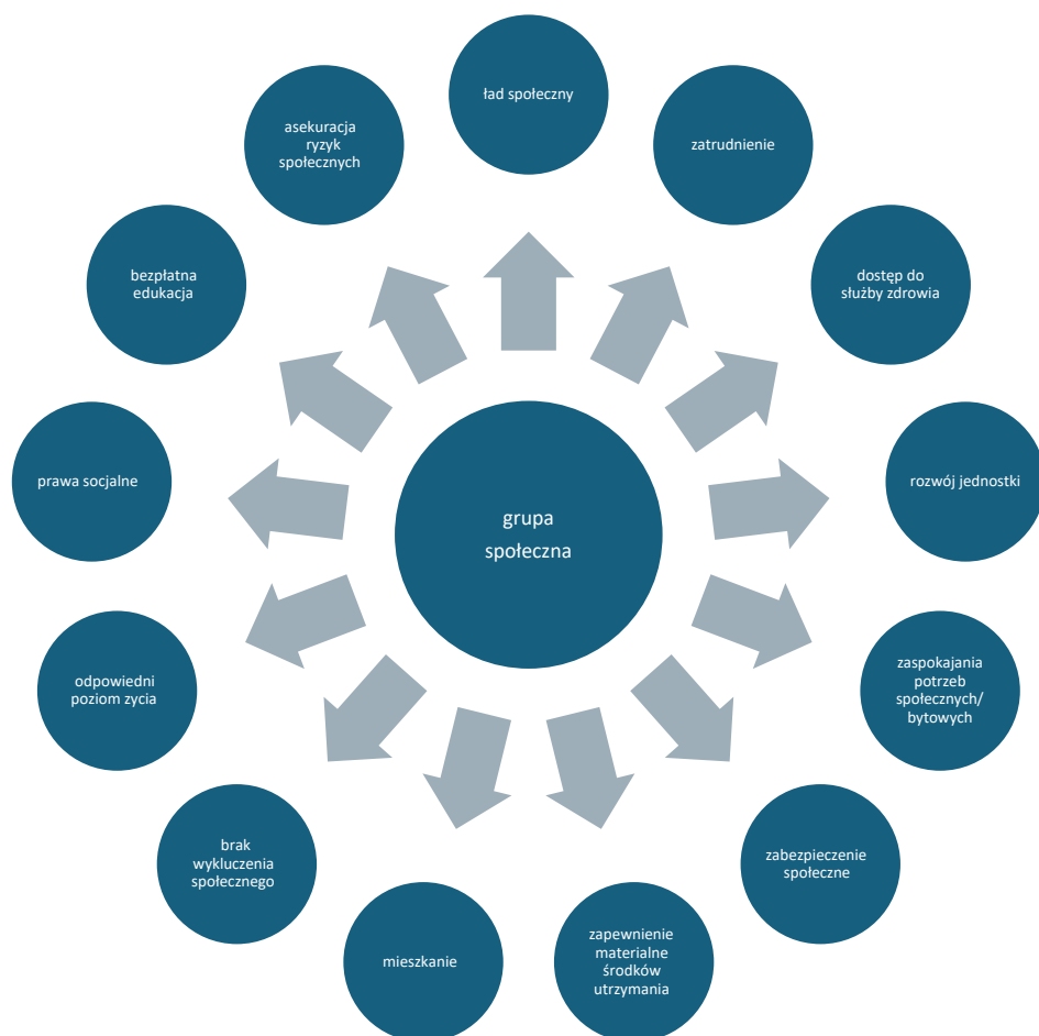
Wykres 2. Elementy bezpieczeństwa socjalnego